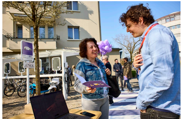
«Clever unterwegs im Quartier» ist im von der Quartierbevölkerung mit viel Interesse aufgenommen worden.

Weiteres Bildmaterial finden Sie im Downloadbereich .