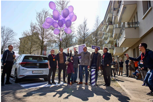
Die neue Mobilitätsstation von clever unterwegs im Weinbergli Luzern ist eingeweiht.