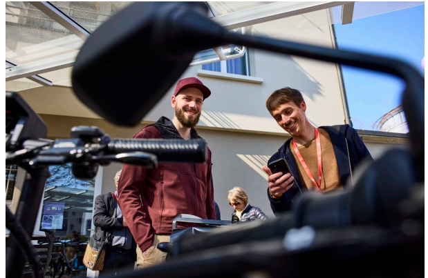
Jung und alt lies sich bei der Eröffnung die Fahrzeuge und die App zeigen, damit die erste Fahrt glückt.