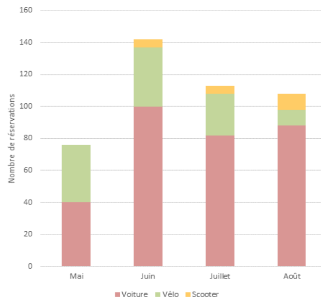
Fréquence d'utilisation mensuelle par type de véhicule