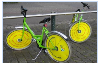
City Bike Helsinki

In den 1980er und 1990er Jahren wurden in verschiedenen Städten, vor allem in Skandinavien, Leihvelos angeboten, die über eine Pfandmünze ausgeliehen werden konnten, analog den Einkaufswagen in Supermärkten. Diese Velos waren aber meist nicht sehr komfortabel und oft in einem schlechten Zustand. Erste Veloverleihprojekte wurden auch in der Schweiz lanciert.