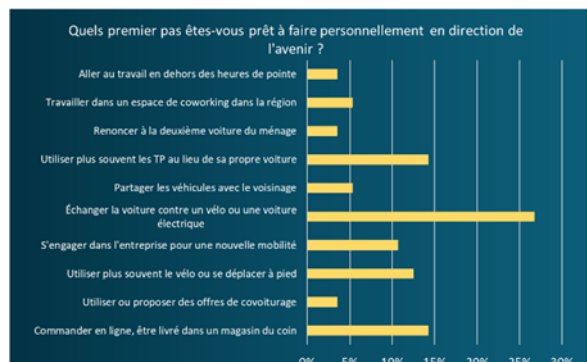
... et montre comment avancer tous ensemble..