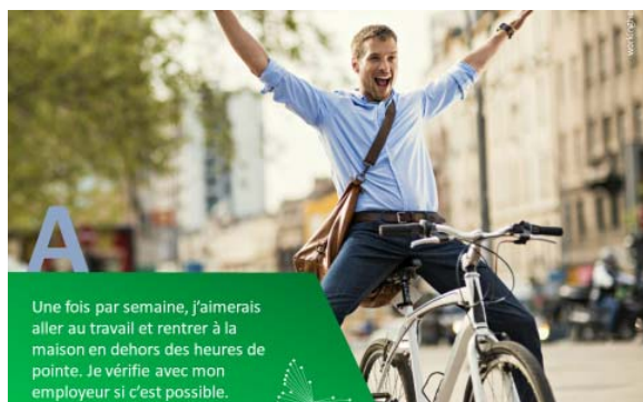
START vous interroge sur votre premier pas ...

En deuxième partie, un atelier amène les participants à discuter des premiers pas qu'ils sont personnellement prêts à faire en direction du futur. Ils débattent ensuite des domaines d'action qu'ils pourraient traiter dans la commune ou la région.