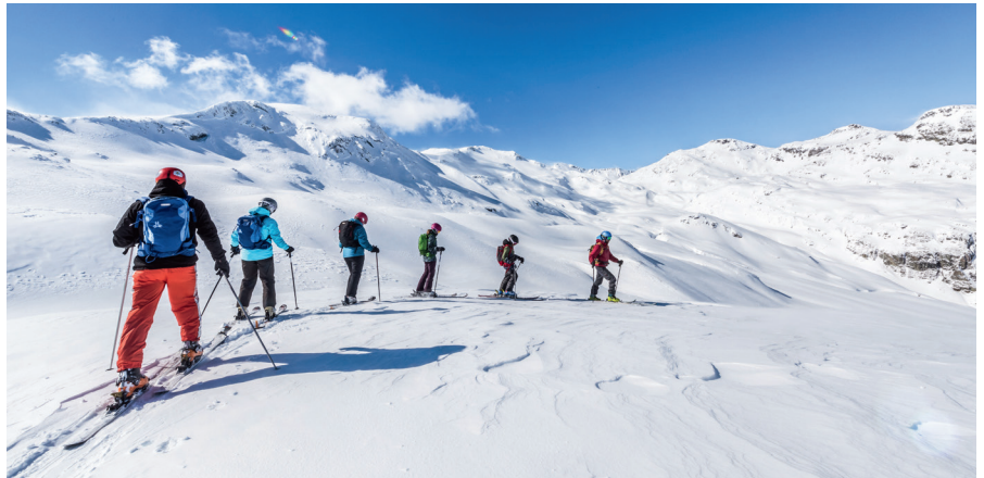
Skitour im Juliergebiet

Der Schneetourenbus ist ein flexibles Busangebot, das ausschliesslich im Internet veröffentlicht wird. Mit der Bündelung der Fahrten auf die nachfragestarken Kurse können Leerfahrten vermieden und Busse besser ausgelastet werden. Dadurch sind moderate Fahrpreise möglich, obwohl die Angebote nicht subventioniert und zudem die Strecken und Fahrzeiten teilweise lang sind. Preisbeispiel: Die 22-Minuten-Fahrt über 10,7 km von Bivio (mit ÖV-Anschluss) zum Julierpass gibt es für 15 Franken.