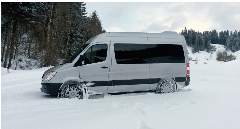
Der Schneetourenbus in der Tourenregion Napf

Durch die mediale Aufmerksamkeit des Pilotprojekts kommen neue Gäste und damit auch KundInnen in die Region. Mit der Reservationsfunktion gibt es zudem Hinweise auf die Auslastung der einzelnen Kurse. Leerfahrten und schlecht ausgelastete Kurse können vermieden werden. Die Transportunternehmen entscheiden selbstständig, welche Fahrten sie durchführen; damit haben sie Kostenkontrolle.