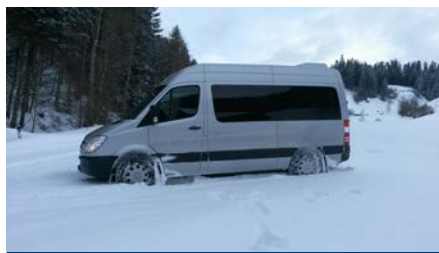
Der Schneetourenbus in der Tourenregion Napf