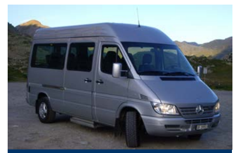
Mit diesem Bus geht's ins Julier-Tourengebiet