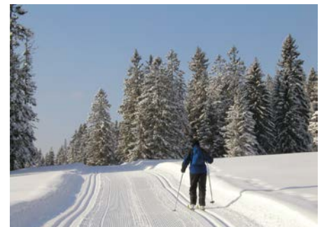
Im Prättigauer Ort Pany wird auch die Langlaufloipe erschlossen