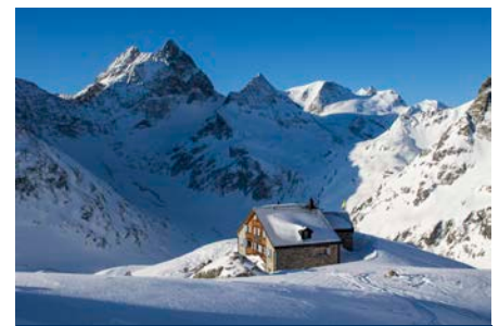
Die Sustlihütte SAC in der Region Susten – ein Stück näher