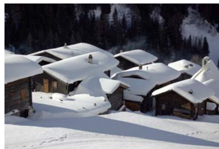
Der Weiler Fäld als Ausgangspunkt zu den Touren im Binntal

Ab 15. November ist der Schneetourenbus online: www.schneetourenbus.ch