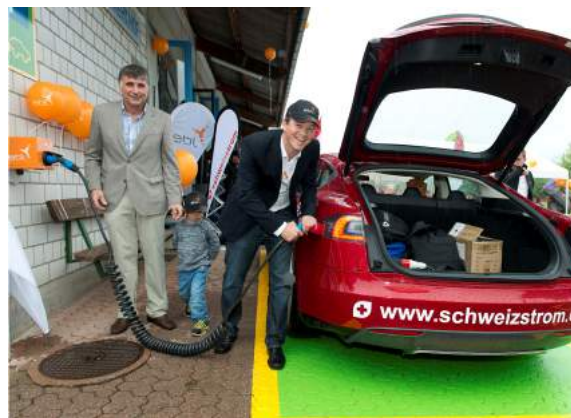
Etappenhalt Wave 2015 in Anwil