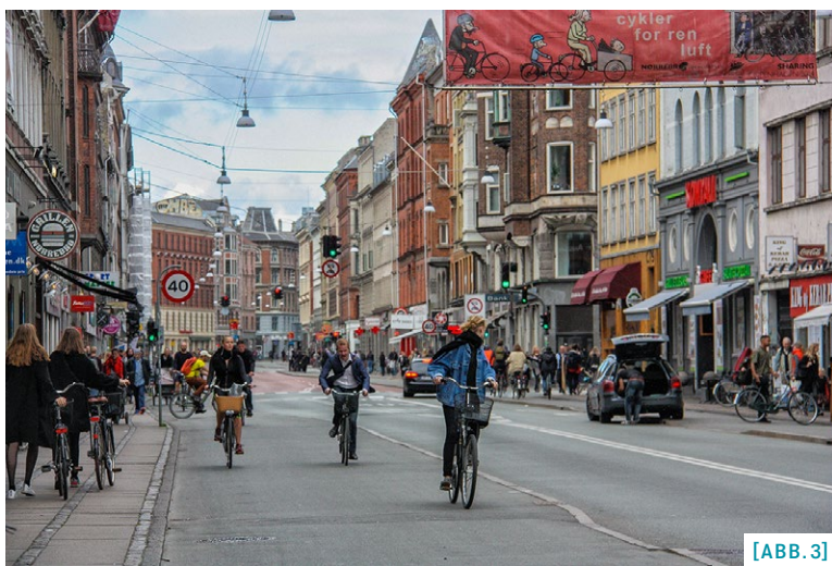
[ABB. 3] Velofahren in Kopenhagen.