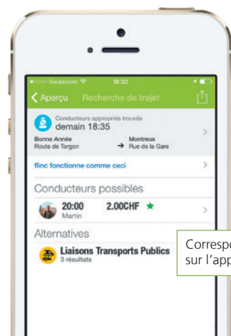
Correspondances des TP sur l'application flinc

En complément au covoiturage, flinc vous propose également les correspondances adéquates en transport public. Lors de votre consultation d'horaire, l'application CarPostal vous présente en un clin d'œil les correspondances des transports publics et les offres de covoiturage. Les conducteurs et les passagers peuvent se contacter directement et préciser les détails de leur trajet commun. Enregistrez-vous gratuitement et n'hésitez pas à tester le système!