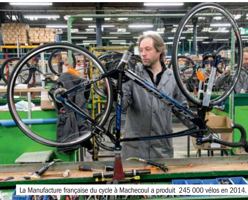
La Manufacture française du cycle à Machecoul a produit 245 000 vélos en 2014.

Une autre piste de développement ? Le vélo à assistance électrique (VAE). « Il permettra de relocaliser la réalisation des pièces en Europe, précise Yves