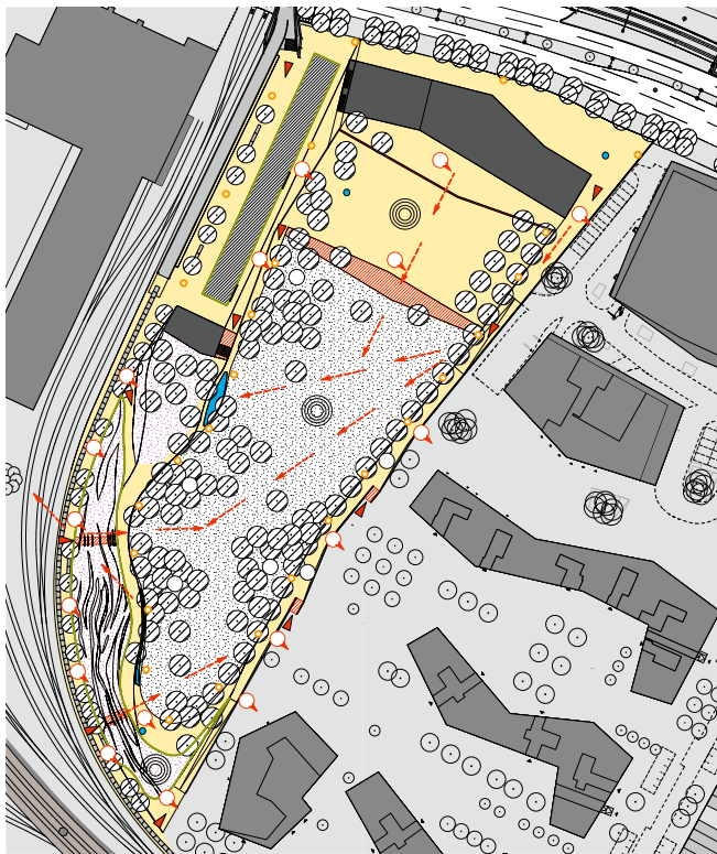
[ABB. 3] Plan soziale Nachhaltigkeit – Gender Mainstreaming.