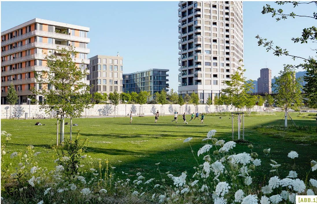
[ABB. 1] Der Pfingstweidpark verfügt über vielfältige Nutzungsangebote.

Das Beispiel des Pfingstweidparks zeigt, wie die unterschiedlichen Bedürfnisse der verschiedenen Menschen, die den Park nutzen, dank einer Genderbeurteilung angemessen im Planungsprozess berücksichtigt wurden.