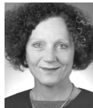
Therese Frösch, Direktorin für Soziale Sicherheit der Stadt Bern, Nationalrätin