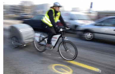
Einkaufen in Biel... Taschen schleppen war gestern!

Nach knapp 2 Jahren bieten bereits rund 40 Geschäfte den Velo-Hauslieferdienst an. 6-7 Langzeitarbeitslose finden im Rahmen der Dienstleistungen eine sinnvolle Tätigkeit nahe am Markt und an der Kundschaft.