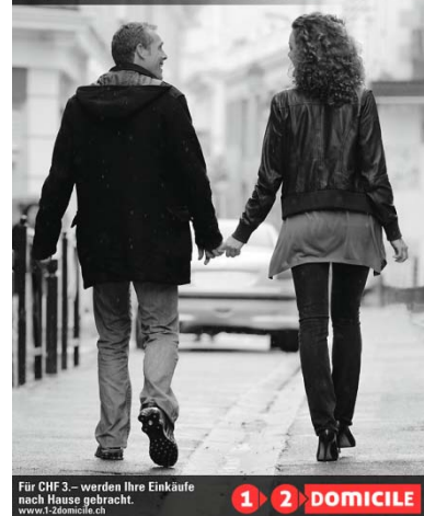
Für CHF 3.- werden Ihre Einkäufe nach Hause gebracht. www.1-2domicile.ch 1 2 DOMICILE