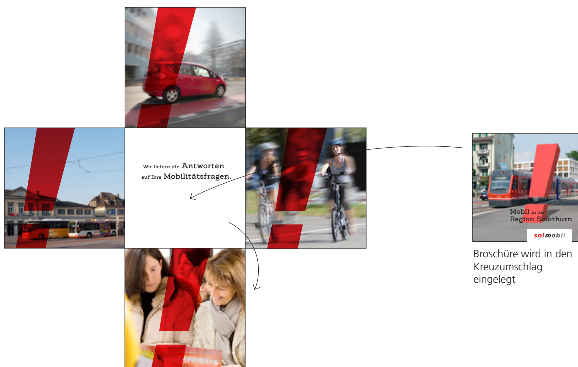
Kreuzumschlag ganz geöffnet