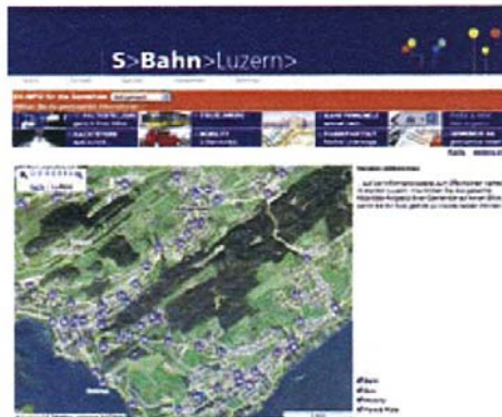
Beispiel: Die öV-Haltestellen im Raum Adligenswil

Alle Haltestellen im Kanton, sämtliche Bahn-, Bus-, Postauto- und Schiffsverbindungen, Fernverkehrszüge, Nachtverbindungen, Park- and Ride-Angebote, Mobility-Standorte, Tarife und spezielle Gemeinde-Angebote sind nun auf einer einzigen Website einsehbar.