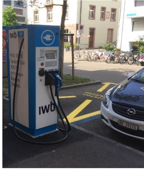
Ladestation in der Blauen Zone (50 kW)