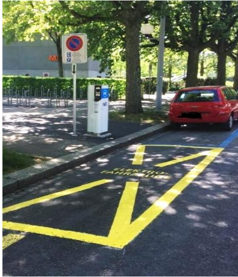
Ladestation in der Blauen Zone (22 kW)