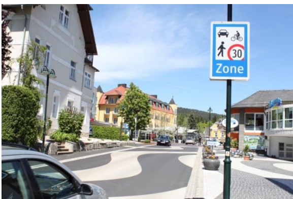
© Amt der Kärntner Landesregierung, Abteilung 9 Straßen und Brücken, Straßenbauamt Klagenfurt

Good Practice Beispiele: Fußgängerzonen in Wien und Ortsraumgestaltung Velden