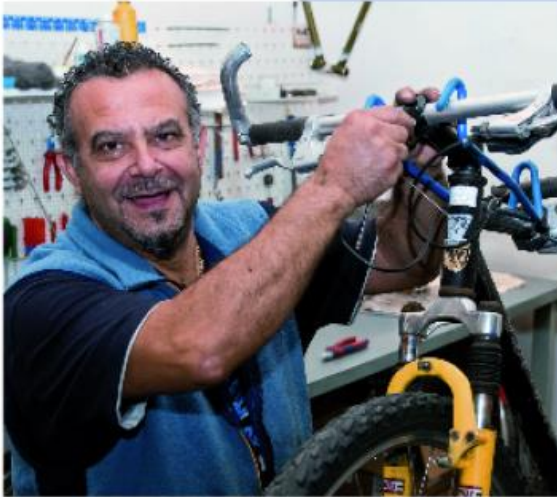
Un programme d'intégration