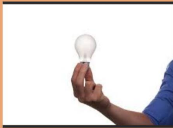
La créativité au coeur du projet