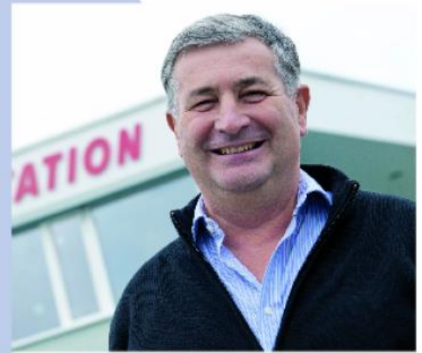
Des chiffres engageants