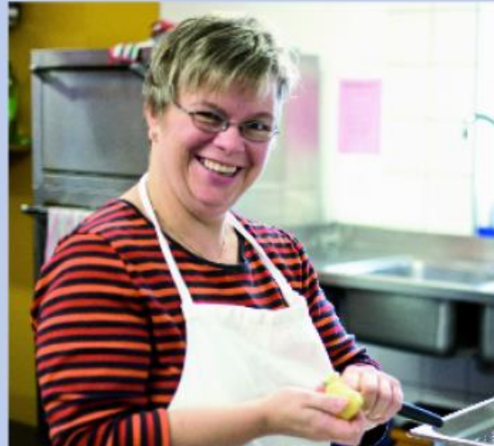
Des synergies productives