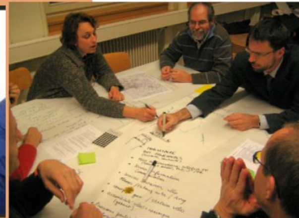
Implication et identification