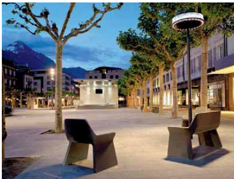
La place Centrale à Martigny est redevenue un lieu calme. | Die Place Centrale in Martigny ist ein Ort der Ruhe geworden.

Le jury salue le fait que les arbres et le mobilier urbain permettent de percevoir la place comme une juxtaposition de petits espaces, mais trouve le kiosque à musique trop imposant. Quant au trafic automobile, il reste présent. Or, en été, la place est déjà interdite aux véhicules pour certaines manifestations; une transformation en zone piétonne serait donc possible. La place Centrale pourrait gagner en importance si l'avenue de la Gare était rénovée. Le processus participatif a impressionné le jury: le projet a fait l'unanimité.