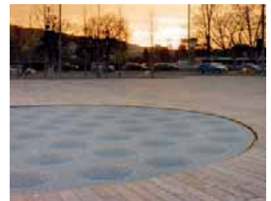
Ein leichtes Relief kennzeichnet den Ort des Wasserspiels. | L'emplacement du jeu d'eau est marqué par un léger relief.