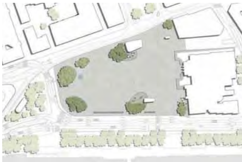
Situationsplan | Plan de situation