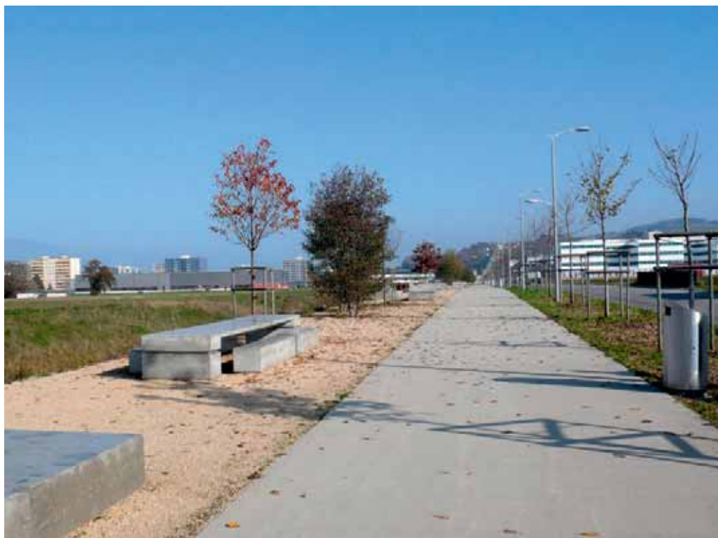
L'environnement favorable aux piétons est déjà là; le parc technologique doit encore s'agrandir. | Die fussgängerfreundliche Umgebung ist schon da, der Technologiepark wird erst noch wachsen.

Ce concept de desserte est exemplaire aux yeux du jury, notamment parce que l'axe central a été déjà entièrement réalisé, bien que seuls quelques bâtiments aient été construits. Les collaborateurs des entreprises qui s'y installeront jouiront, dès le premier jour, d'un cadre attrayant. La liaison avec la ville doit encore être améliorée.