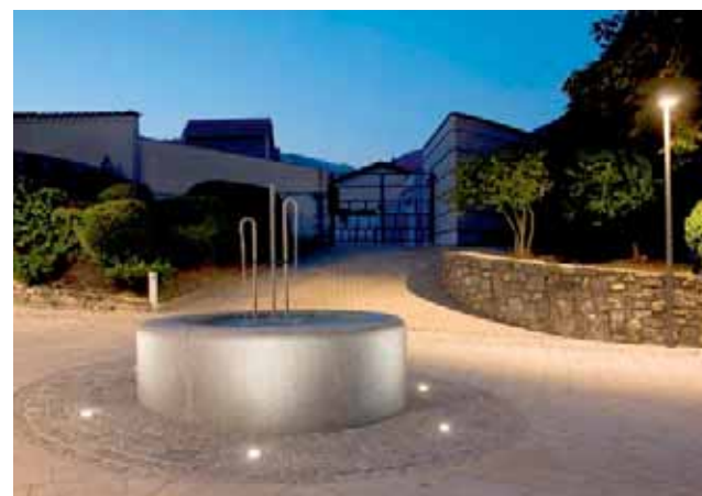
Ein Brunnen ergänzt die Gestaltung. | L'aménagement est complété par une fontaine.