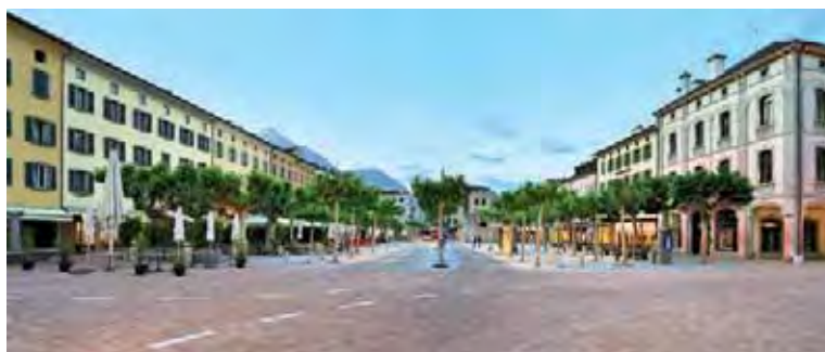
L'ambiance méditerranéenne prédomine. | Südländisches Flair bestimmt die Atmosphäre.