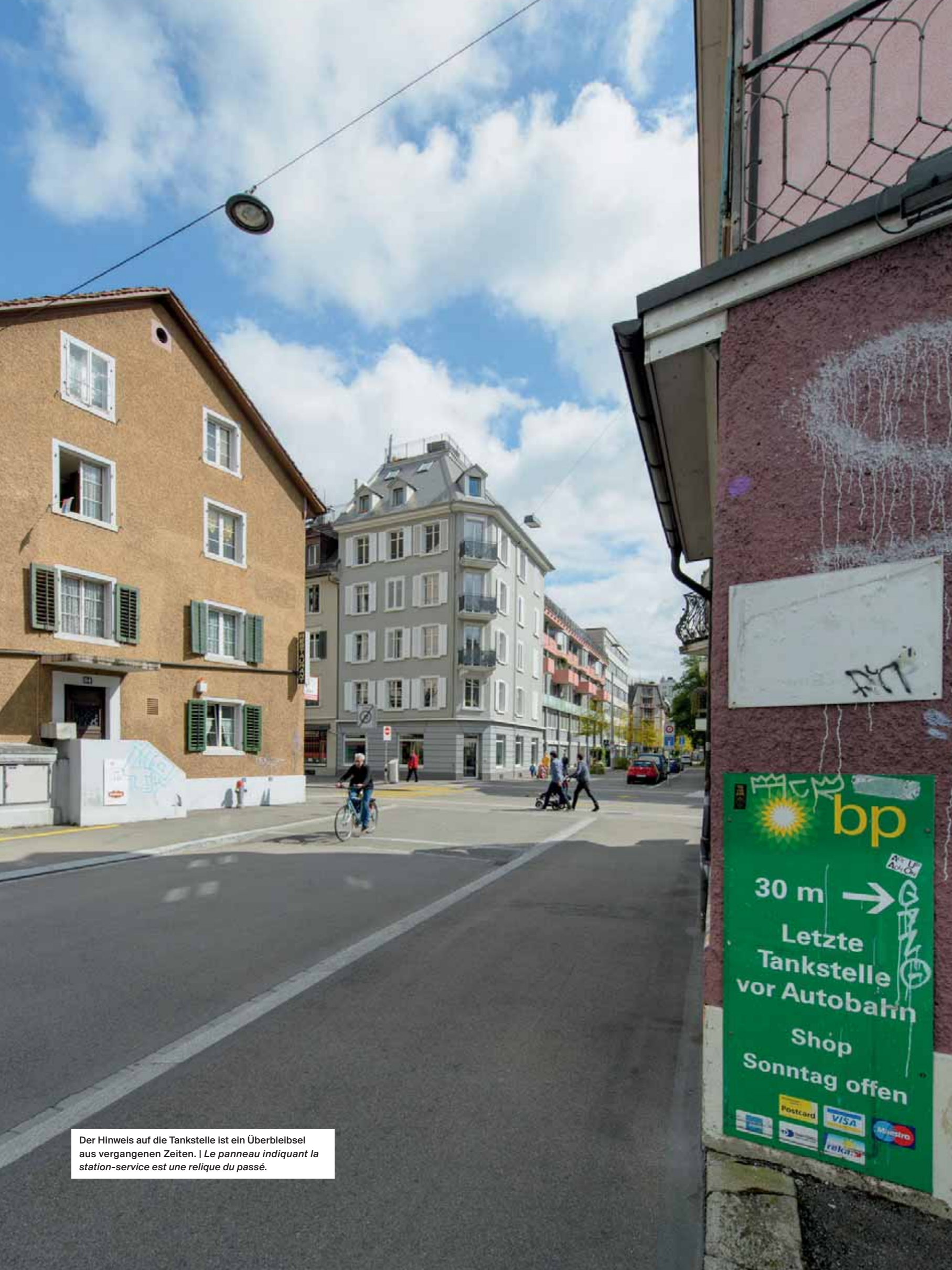
Der Hinweis auf die Tankstelle ist ein Überbleibsel aus vergangenen Zeiten. | Le panneau indiquant la station-service est une relique du passé.