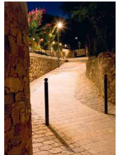
Ein Band aus grossformatigen Granitplatten ist von einer Pflasterung eingefasst. | Une bande centrale en dalles de granit grand format est bordée par un pavage.