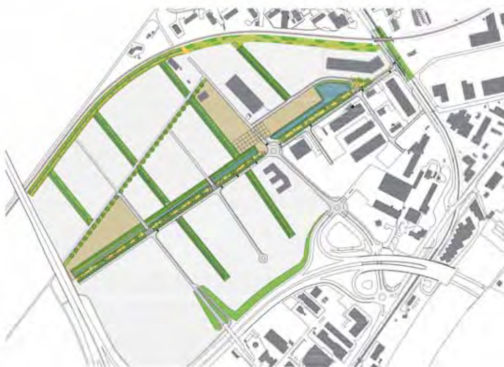
Plan de situation | Situationsplan