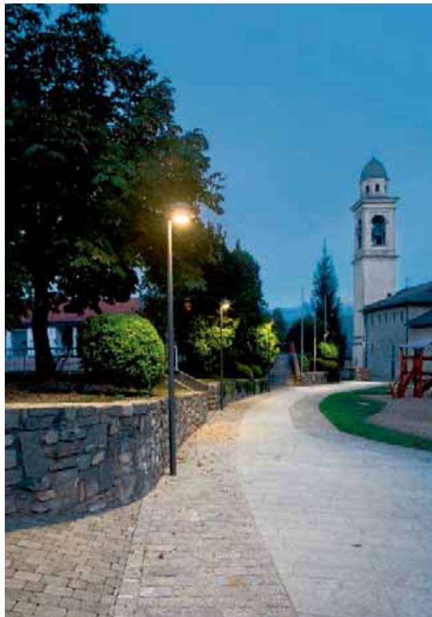
Das Tessiner Dorf Pura hat ein neues Zentrum erhalten. | Le village tessinois de Pura a un nouveau centre.