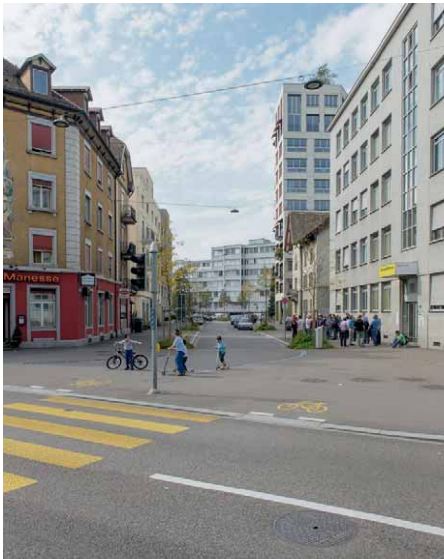
Hier floss der Verkehr aus der Weststrasse um die Ecke zum Sihlhölzli. Es war die letzte Ampel vor der Autobahn. | Ici, la circulation débouchait au Sihlhölzli, à l'angle de la Weststrasse. C'était le dernier feu rouge avant l'autoroute.

Ein markanter Neubau steht an einem der einst meistbelasteten Abschnitte der Westtangente, wo sich die Autos vor der Ampel beim Sihlhölzli stauten: das Hochhaus an der Ecke Weststrasse–Werdstrasse. Hier bieten Wohnungen Lebensraum, und im Erdgeschoss lädt das Café-Bistro Salon zu Speis und Trank ein. Es ist das Gegenstück zum Café du Bonheur am Bullingerplatz und eine gute Gelegenheit, den Stadtbummel abzuschliessen – mit Blick auf die Grünanlage gegenüber und den Uetliberg im Hintergrund.