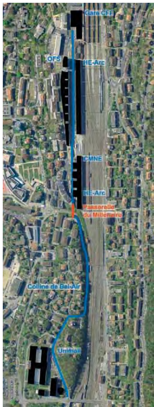
La passerelle est située à mi-parcours du chemin piéton qui longe les voies ferrées. | Der Fussweg verläuft parallel zu den Gleisen, die Passerelle sitzt in der Mitte.