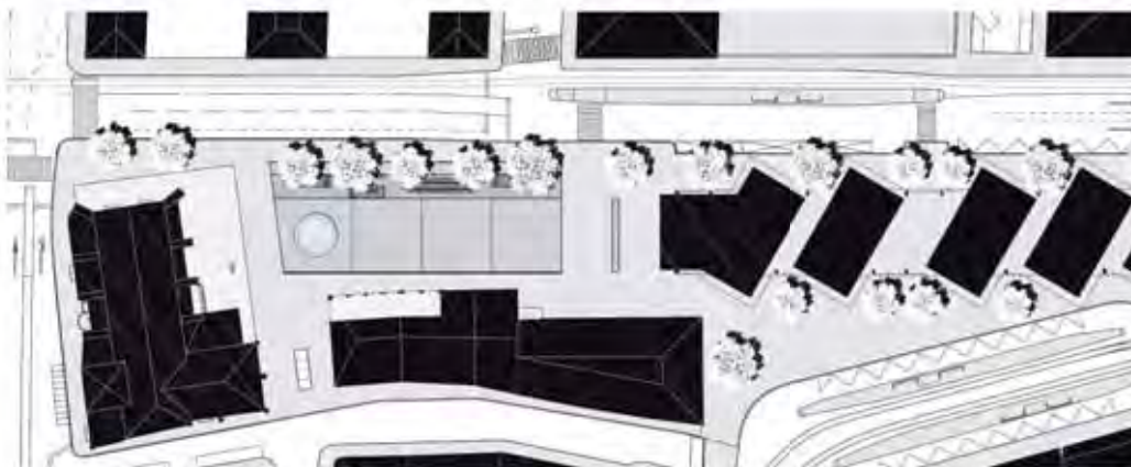
Plan de situation | Situationsplan