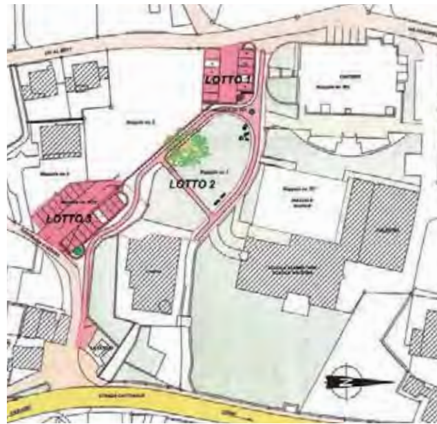
Situationsplan | Plan de situation

Bauherrschaft | Maître d'ouvrage : Municipio di Pura Projekt | Projet : Marco Bausch, Pura; Studio BRC, Agno Revitalisierung | Revitalisation : Pedrazzini Costruzioni, Lugano; Pavinord, Bellinzona; Imphenia, Bioggio; Montemarano Donato, Pura Kosten | Coûts : Fr. 1,1 Mio.