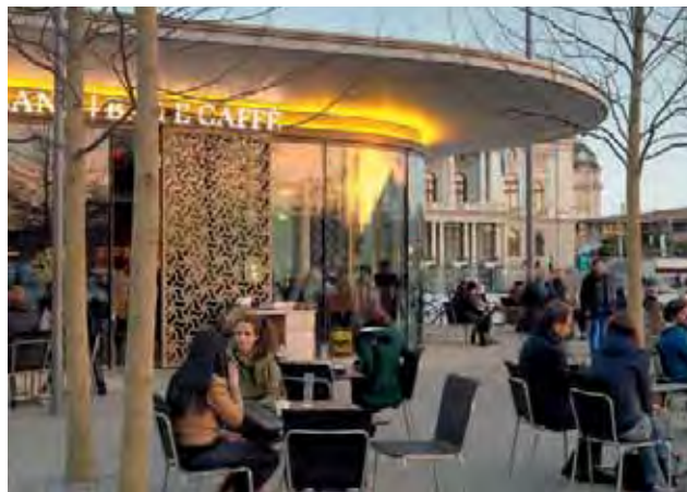
Ein Café belebt den Rand des Platzes. | Un café anime le bord de la place.