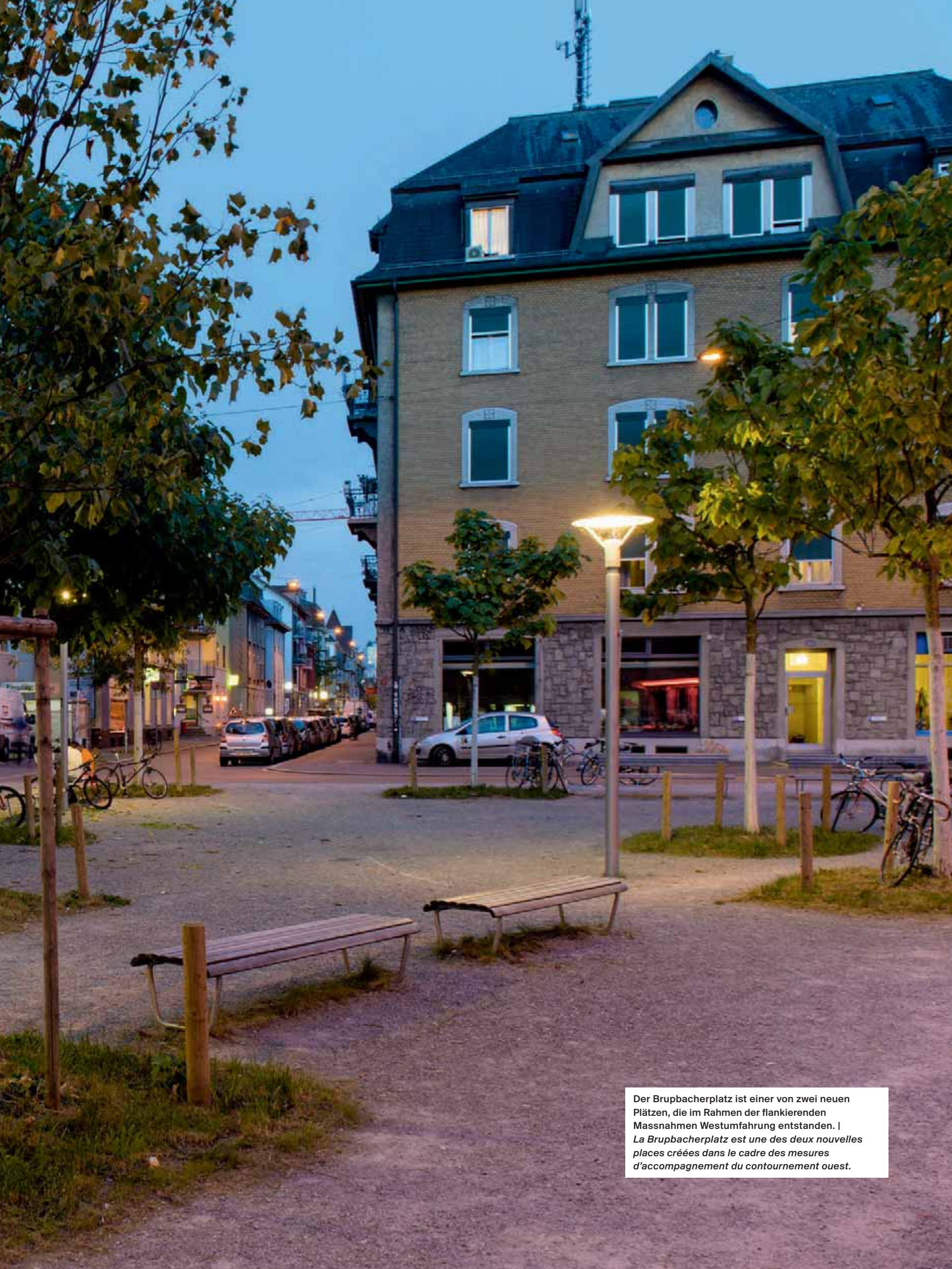
Der Brupbacherplatz ist einer von zwei neuen Plätzen, die im Rahmen der flankierenden Massnahmen Westumfahrung entstanden. | La Brupbacherplatz est une des deux nouvelles places créées dans le cadre des mesures d'accompagnement du contournement ouest.