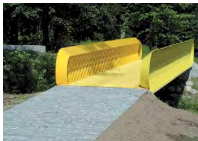
Kurz, aber effektiv: die gelbe Brücke. | Petit mais bien visible: le pont jaune.