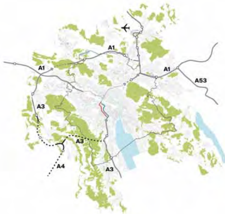
Autobahnnetz rund um Zürich | Réseau autoroutier autour de Zurich --- bestehend | existant --- neue Westumfahrung | nouveau contournement ouest — Achse Schimmelstrasse-Seebahnstrasse (Zweirichtungsverkehr) | axe Schimmelstrasse-Seebahnstrasse (circulation bidirectionnelle) — Achse Sihlfeldstrasse-Weststrasse (verkehrsberuhigt) | axe Sihlfeldstrasse-Weststrasse (circulation réduite)