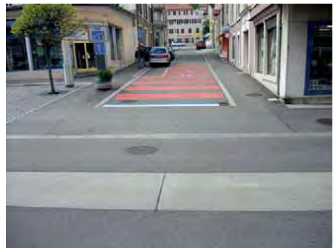
Bandes centrales, bande en pierre naturelle, trottoir continu. | Mittelstreifen, Natursteinband, Trottoirüberfahrt.