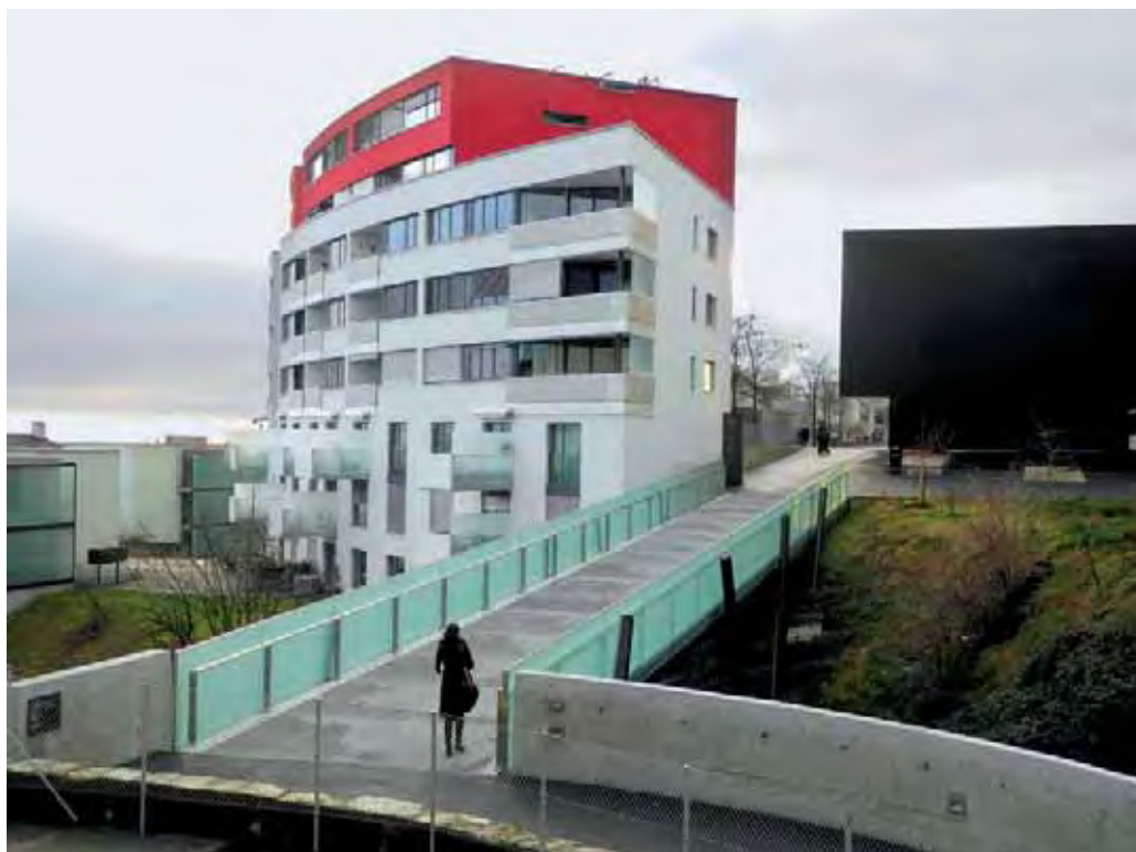
A Neuchâtel, la passerelle relie l'Espace de l'Europe près de la gare au quartier de Bel-Air. | Die Passerelle in Neuenburg verbindet den Espace Europe beim Bahnhof mit dem Quartier Bel-Air.

Maître d'ouvrage | Bauherrschafft: Direction de l'urbanisme de la Ville de Neuchâtel, avec prise en compte des différentes propriétaires fonciers | Planungsamt der Stadt Neuenburg unter Einbezug verschiedener Grundeigentümer Projet | Projekt: Bauart Architectes, Neuchâtel; GVH Ingénieurs civils, Saint-Blaise Coûts | Kosten: Fr. 1,555 Mio.