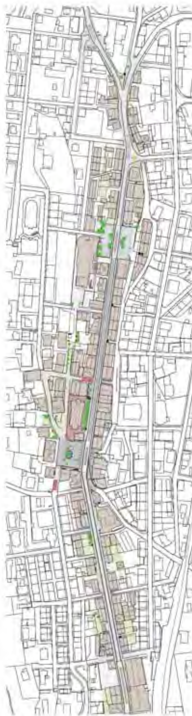
Plan de situation | Situationsplan

Maitre d'ouvrage | Bauherrschaft: Canton de Berne, Office des ponts et chaussées; Ville de Saint-Imier Projet | Projekt: RWB Jura, Porrentruy Coûts | Kosten: Fr. 11 Mio.