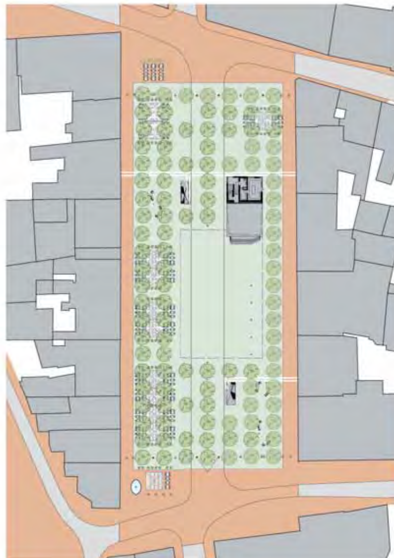
Plan de situation | Situationsplan