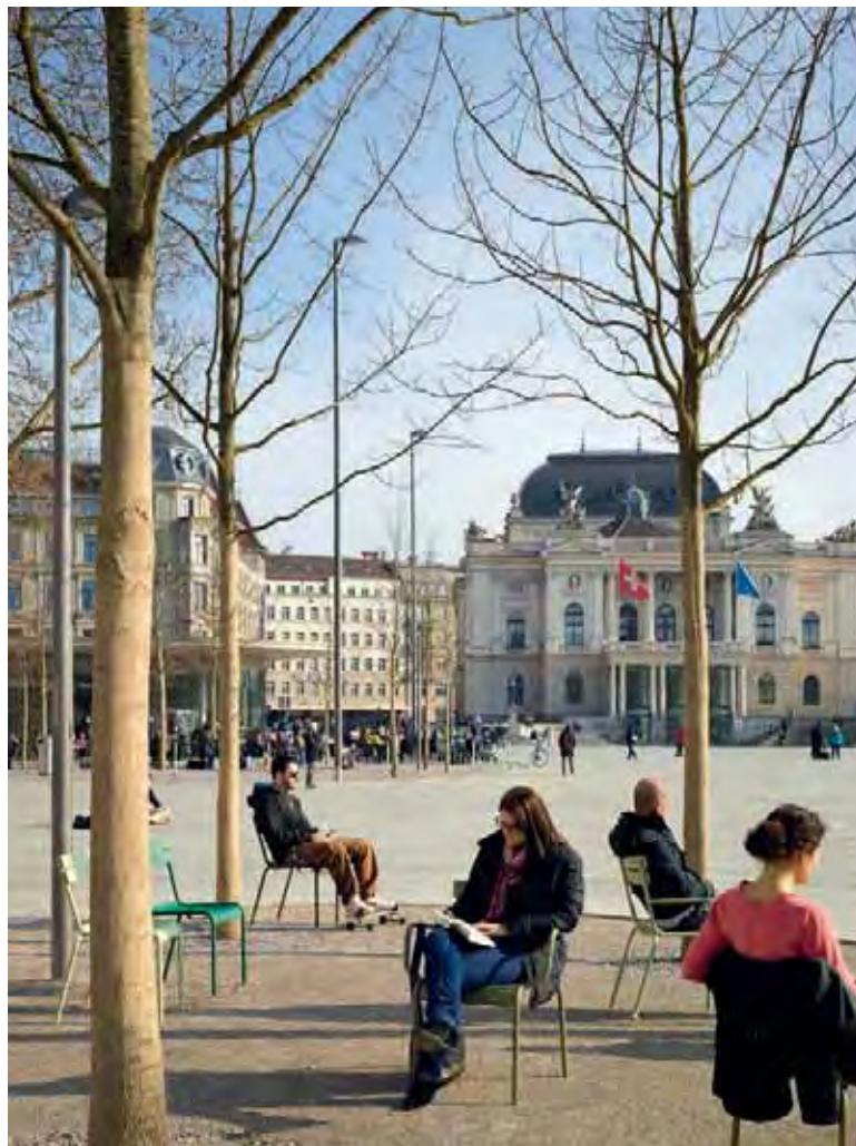
Zürich hat einen neuen Ort zum Verweilen: den Sechseläutenplatz. | Zurich possède un nouveau lieu où flâner: la Sechseläutenplatz.

Bauherrschaft | Maître d'ouvrage: Stadt Zürich, Tiefbauamt Projekt | Projet: Generalplanerteam Opus One (Zach + Zünd Architekten, Heyer Kaufmann Partner Bauingenieure; Vetschpartner Landschafts- architekten, Perolini Baumanagement; Amstein + Walthert Gebäudetechnik) Kosten | Coûts: Fr. 17 Mio. (Platzgestaltung)