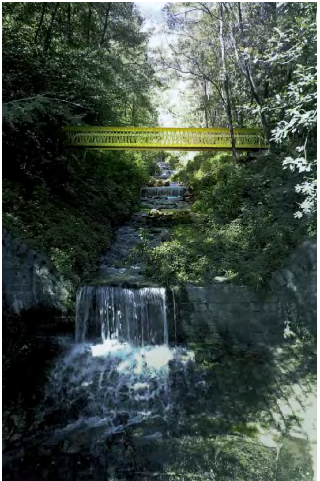
Die Fussgängerbrücke in Lumino ist ein starkes Zeichen in der Landschaft. | La passerelle de Lumino constitue un signal fort dans le paysage.