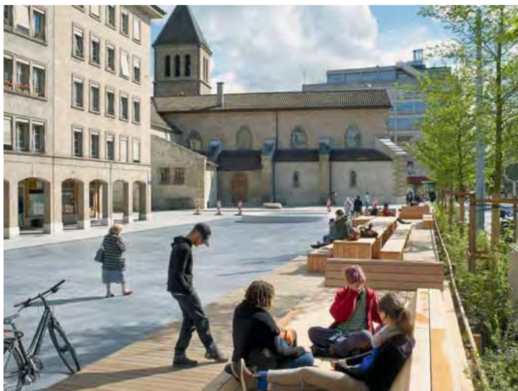
Une plateforme en bois avec des tables, des bancs et des «sofas» invite à la détente. | Ein Holzdeck mit Tischen, Bänken und «Sofas» lädt zum Verweilen ein.