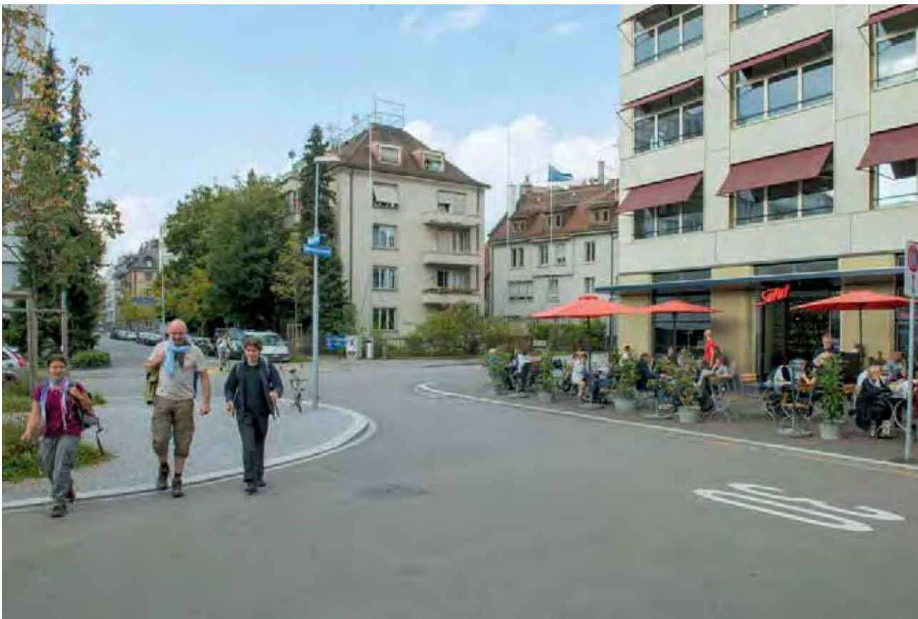
Wo heute die Gäste des Cafés und Bistros Salon sitzen, war früher ein Moloch des Verkehrs. | Là où les clients du café-bistro Salon sont tranquillement assis, la circulation était autrefois colossale.

→ Planer die vorhandenen Stadträume – die Strassen und Plätze – und erarbeiteten daraus ein städtebauliches Konzept. Zwei neue Plätze wurden definiert: der Brupbacher- und der Anny-Klawka-Platz.