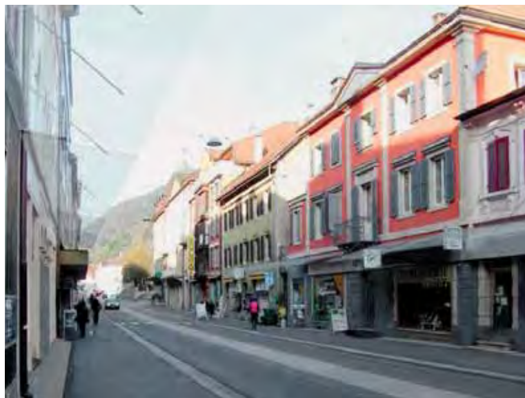
A Saint-Imier, une bande centrale permet de traverser la route cantonale en deux étapes. | Ein Mittelstreifen soll es ermöglichen, die Kantonsstrasse in Saint-Imier in zwei Etappen zu überqueren.