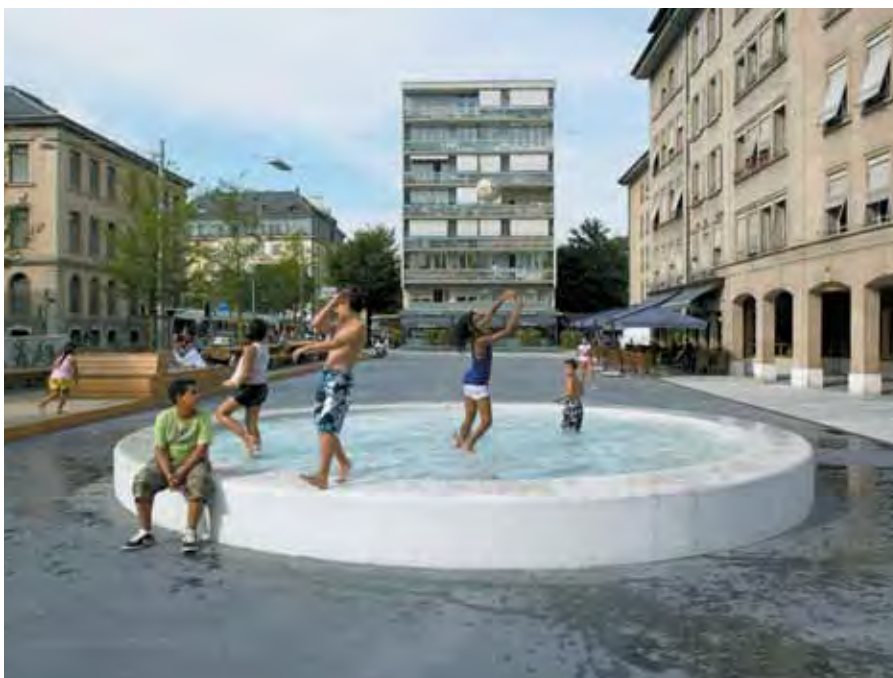
La fontaine de la place Simon-Goulart constitue une attraction à Genève. | Der Brunnen ist eine Attraktion auf der Place Simon-Goulart in Genf.

Maître d'ouvrage | Bauherrschaft: Ville de Genève Projet | Projekt: Atelier Descombes Rampini, Genève; B. Ott & C. Uldry, bureau d'ingénieurs civils, Genève; LEA Eclairagistes, Lyon Coûts | Kosten: Fr. 4,56 Mio.