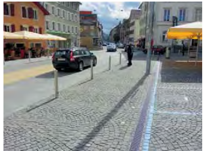
Le trafic reste important. | Der Verkehr ist nach wie vor erheblich.