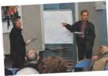
Groupes de travail