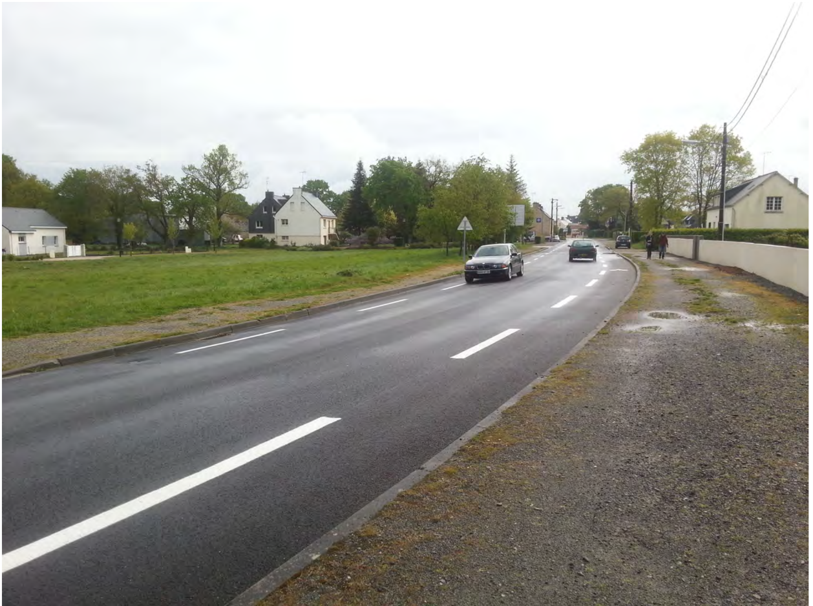
Chaussée à voie centrale banalisée (cadrage réglementaire en préparation)