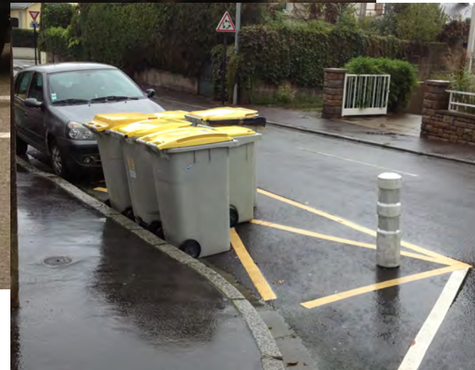
Le dégagement des trottoirs