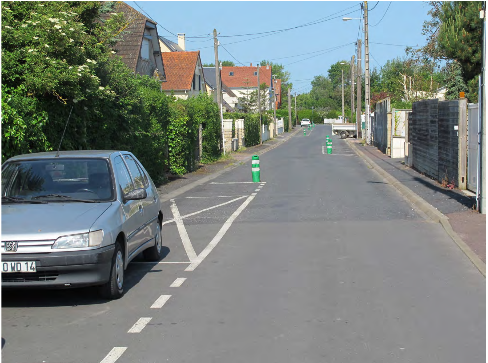
Stationnement créateur de chicanes