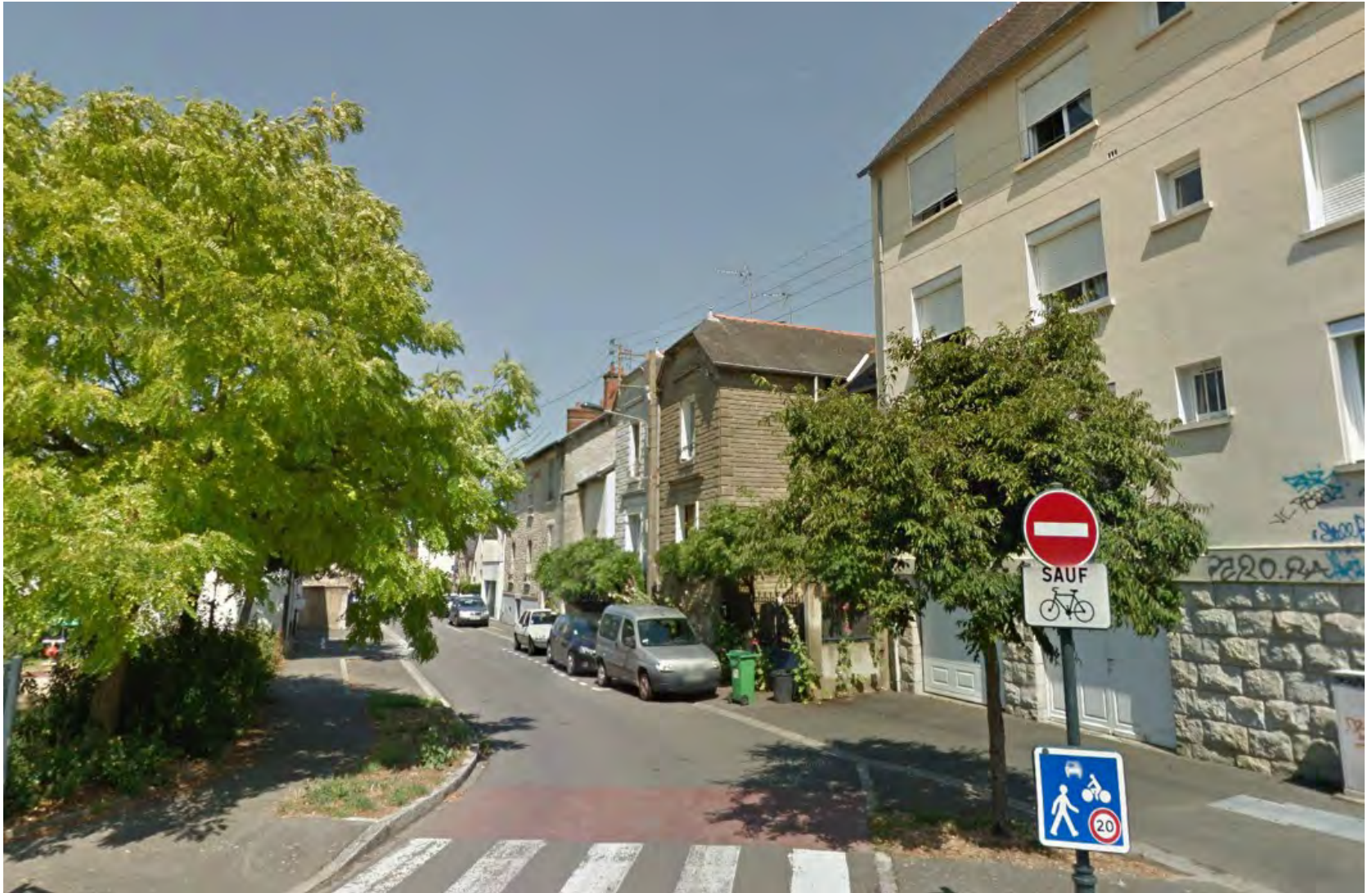
Rues résidentielles en zone de rencontre