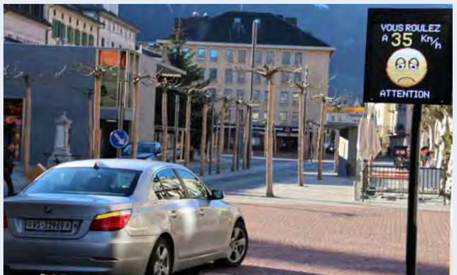
Martigny. Sensibilisation des conducteurs en entrée de la zone de rencontre à la place Centrale