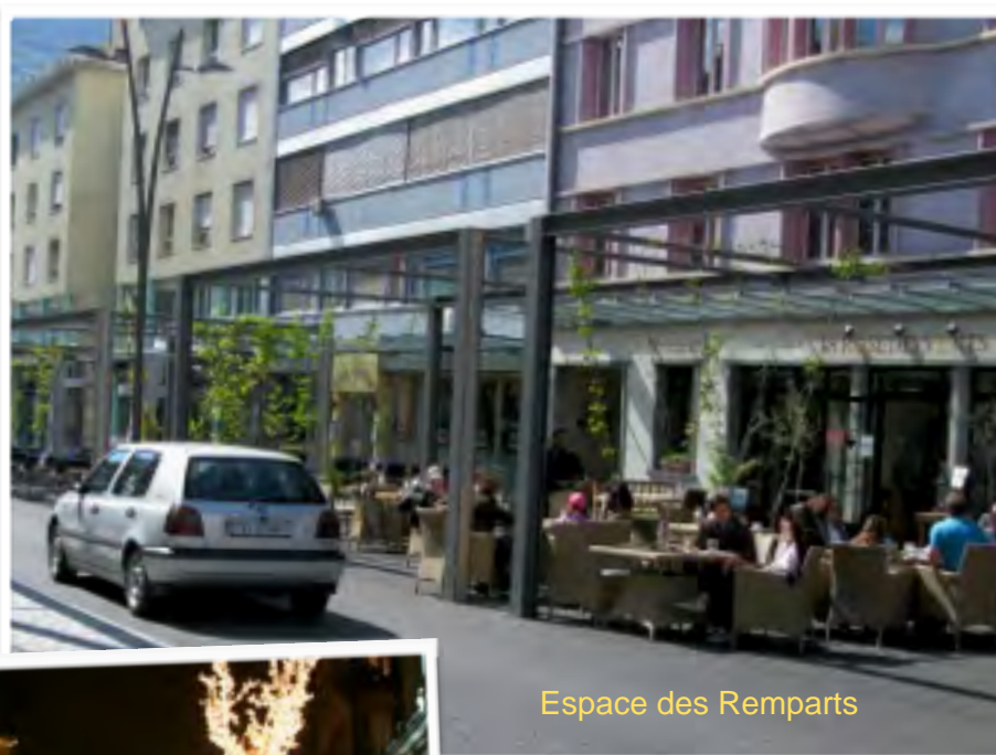
Espace des Remparts