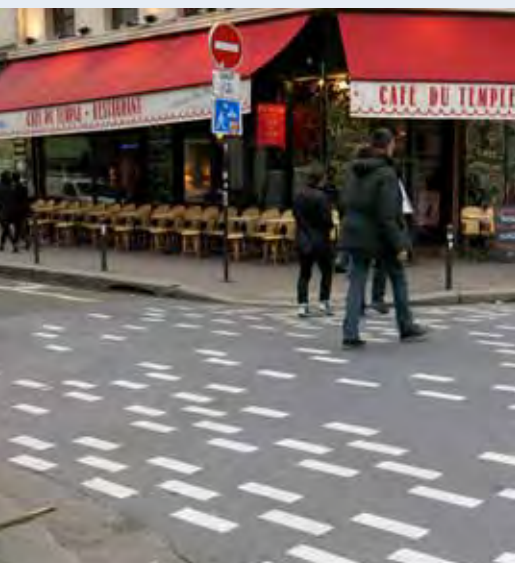
Paris. Expérimentation de marquages dans les zones de rencontre: type «pixels»

Mise à jour du programme détaillé et inscriptions sur www.rue-avenir.ch