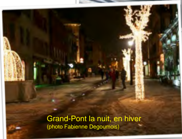
Grand-Pont la nuit, en hiver