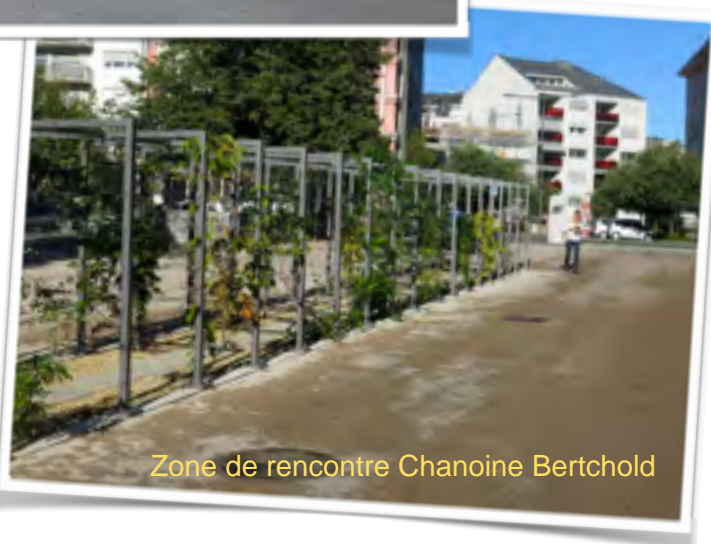
Zone de rencontre Chanoine Bertchold

Créé en 1981, Rue de l'Avenir (RdA) est une association indépendante, active en Romandie, au service notamment des communes, des professionnels, des associations de parents et des groupes d'habitants.